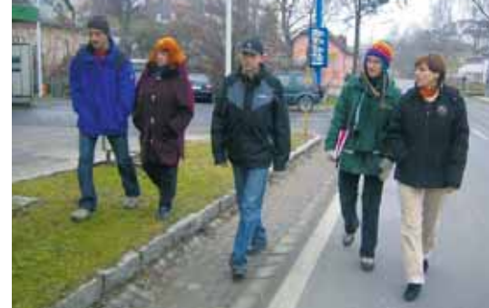
Begehung vor Ort mit dem Boku-Team: Schulwegsicherung war ein Thema.

ein Herzensanliegen ist. Anfang Dezember rückten VertreterInnen von Gemeinde, Schule und Elternverein aus, um die neuralgischen Punkte des Schulweges zu orten und unter der kundigen Führung des BOKU-Teams so manchen Augenöffner zu erleben. Man dachte gemeinsam Lösungen an. Auch die günstigste Erschließung einer neuen Siedlung wurde erörtert. Im Frühling und Frühsommer präsentierte das Projektteam erst im Gemeinderat Unterweißenbach und dann auf der BOKU in Wien den Zwischenbericht. Zu Schulschluss fand ein