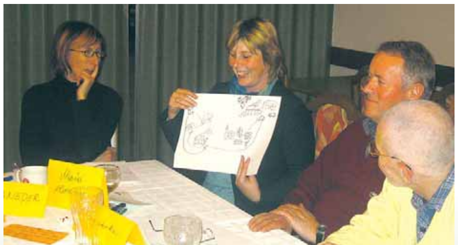
Beim Stammtisch zum Thema Lebensqualität im Bauen & Wohnen wurden Gedächtnislandkarten angefertigt. Diese zeigten deutliche Männer-/Frauen-Unterschiede.

kungen vor, die bereits im April im Rahmen einer Lehrveranstaltung erfasst worden waren. Man befragte die Anwesenden zu ihren Vorstellungen von Lebensqualität und entwickelte daraus Themen für die nachfolgenden Stammtische: Wie kann man alterungs- und anpassungsfähige Siedlungen bauen? Wo schafft man Frei- und Begegnungsräume? Als besonders aktuell erwies sich die Schulwegsicherung, die dem engagierten Elternverein