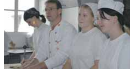
40 Lehrplätze stehen derzeit zur Wahl

Das Team der Jugendtankstelle freut sich auch über Einladungen von Jugendgruppen und Fachausschüssen, um die Anliegen der Jugendlichen weiterhin vertreten zu können