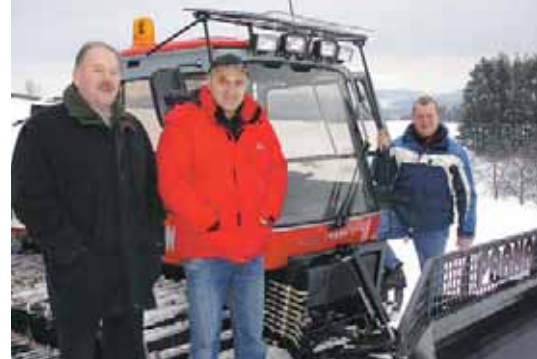
Tourismusverband und Gemeinde haben in Bad Zell für optimale Loipen aufgerüstet.

Skating – zur Verfügung. Die Loipenkarte ist im Tourismusbüro, am Gemeindeamt und bei den Langlaufwirten erhältlich. Beim Loipenstart, der Arena Bad Zell, stehen 45 Paar Leihski zur Verfügung. Loipeninformationen: Tourismusbüro (Tel.: 07263/7516) und Arena (Tel.: 07263/20097)