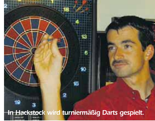
In Hackstock wird turniermäßig Darts gespielt.