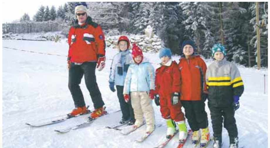
Ob blutige Anfänger oder Rennläufer: Alle haben auf der Schorschi-Piste ihren Spaß. Sieben „Schorschis“ sind ausgebildete Lehrwarte oder Jugendbetreuer.