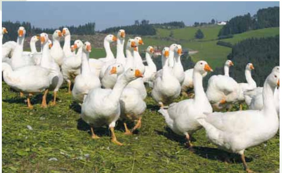
Die Gänse waren aus dem Erscheinungsbild der Bauernhöfe fast völlig verschwunden. Heute sind die Weidegänse österreichweit wieder auf dem Vormarsch.