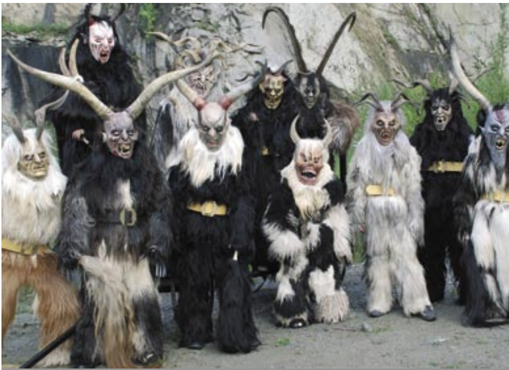
Die „Laungastoana Schiachperchten“ treiben am 7. Dezember ihr Unwesen in Königswiesen.