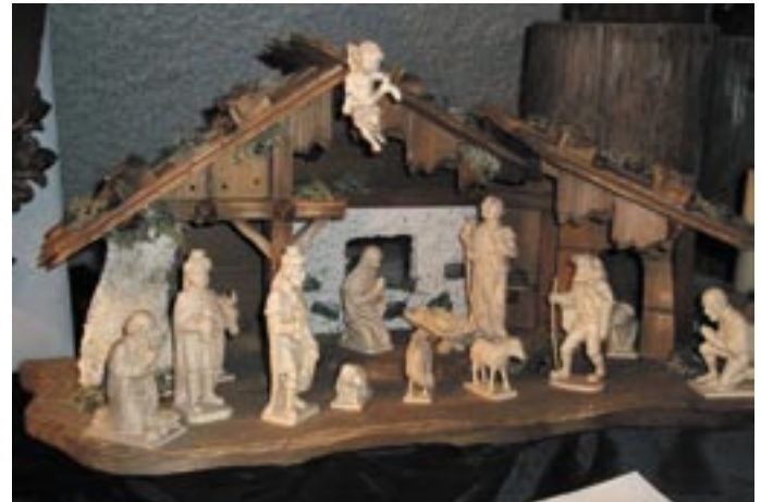
Die Krippenschau ist nicht nur für kleine BesucherInnen ein Erlebnis.

Z ur winterlichen Laternenwanderung wird um 17 Uhr abmarschiert. Um 18 Uhr wird auf dem Marktplatz ein Hirtenspiel aufgeführt, und um 19 Uhr beschließt eine Abendmesse in der Pfarrkirche den ersten Markttag. Bereits um 8 Uhr ist am Sonntag Verkaufsbeginn an den Adventstandln. Am Nachmittag, und zwar um 14 Uhr, haben die Kindergartenkinder ihren großen Auf-