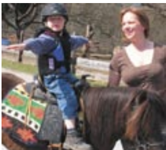
Therapie und Freizeitbeschäftigung mit Pferden werden bei Equi-cation verbunden.