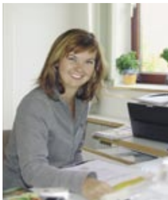
Qualifizierte (Teilzeit)-Frauenarbeitsplätze in der Region sind Mangelware. Die meisten berufstätigen Frauen sind gezwungen, den Hauptwohnsitz zu ihren Arbeitsstätten zu verlegen.

Zwei Möglichkeiten gibt es für die Region: Den langsamen Niedergang aufgrund der schrumpfenden Einwohnerzahl zu verwalten - oder sich für nachhaltige, zukunftsfähige Strukturen stark zu machen.