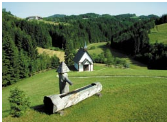
Johannesbrunnen mit Engelskapelle in Pierbach