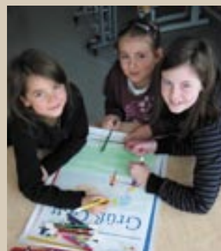
Mit viel Eifer gestalten die Kinder von Kindergarten und Volksschule Plakate zum Schwerpunkt gutes Benehmen.

Ein gemeinsamer Gottesdienst bildete die „Aufaktveranstaltung“, in der die Schönauer Bevölkerung informiert wurde. Alle TeilnehmerInnen des Gottesdienstes bekamen einen Blumengruß überreicht. Ein leichter Trend zu mehr Aufmerksamkeit in diesem sensiblen Bereich ist schon zu erkennen. Im Frühjahr 2012 wird die zweite Plakatserie gestaltet und aufgehängt und aufgestellt. Der Gruß wird noch nicht verraten!